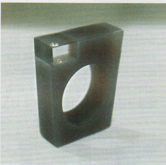
Thomas Stoffel Schmuck / Edelstein (Stipshausen)